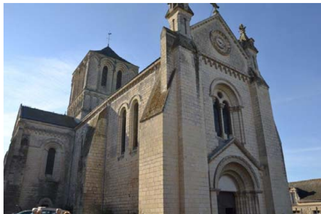
Eglise de Brion