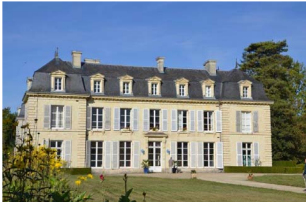
Château des Hayes