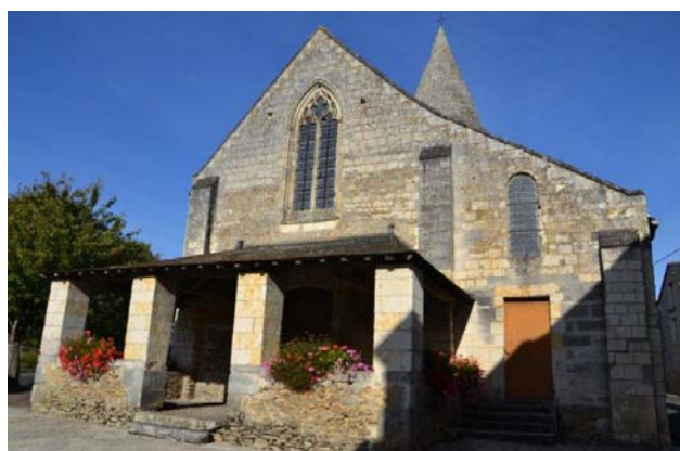
Eglise de Cuon