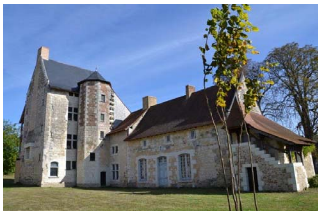
Château de Vaux