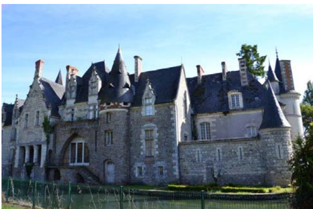
Château de la Graffinière